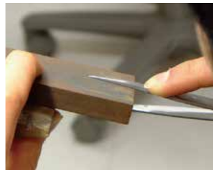
基礎工具の整備・調整

【使用教材(予定)】 ・CITIZEN82(自動巻き機械式時計) ・SEIKO 7N43C(クォーツ時計)